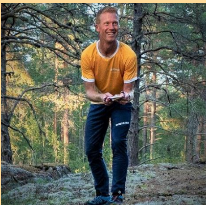
God Jul och Gott Nytt O-Ringenår /Jens Lindquist Projektledare